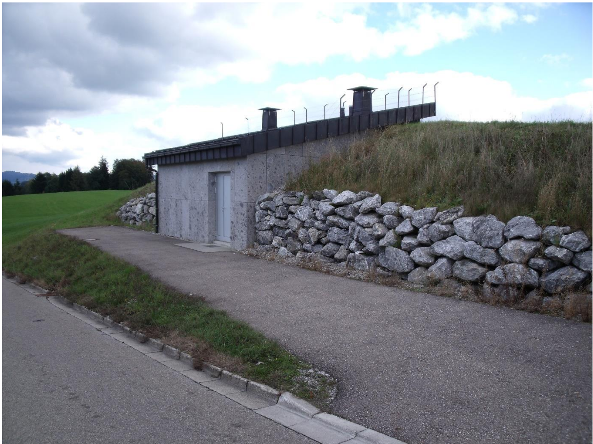
Hochbehälter in Geigersthal