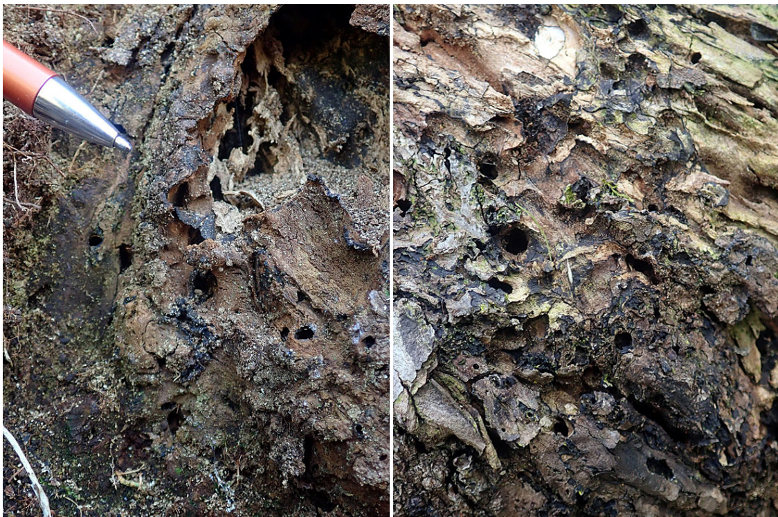
Abbildung 9: Schlupflöcher von totholzbewohnenden Käfern in der Linde, 11.8.2021.