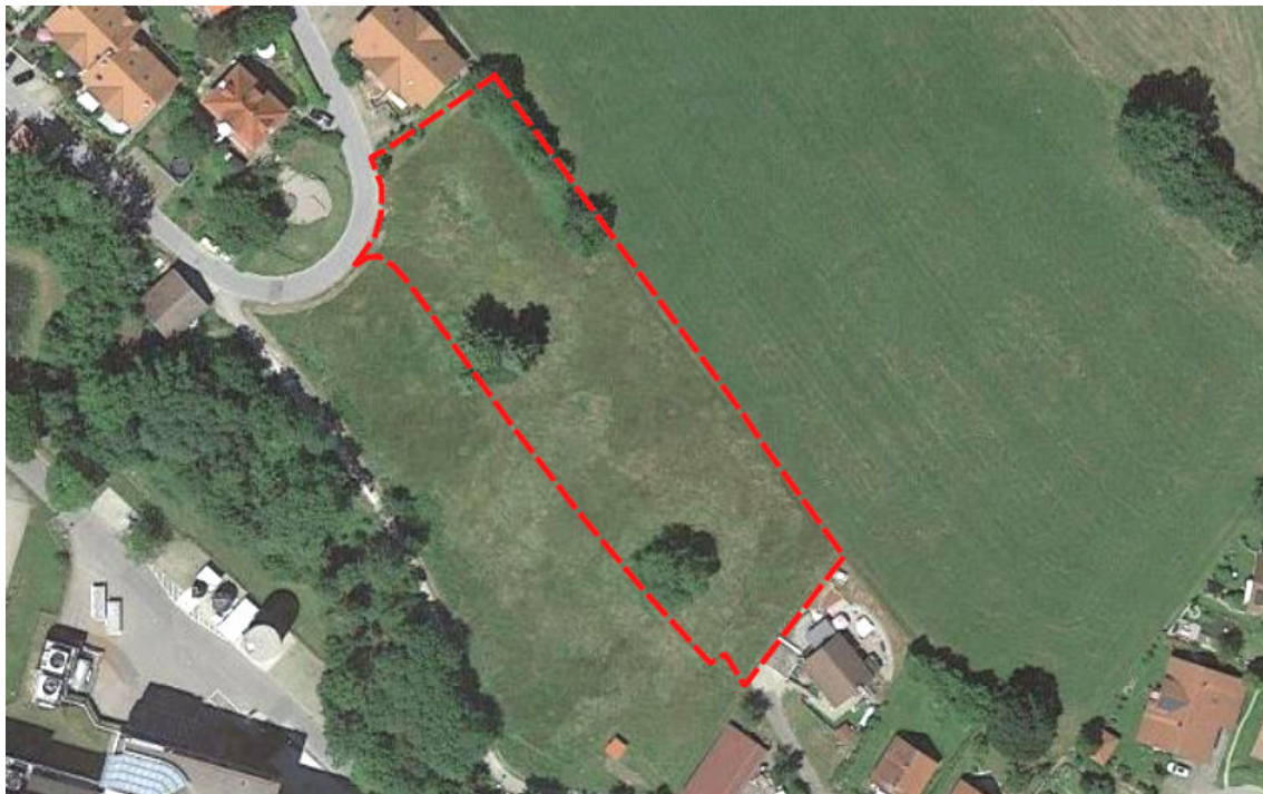
Abbildung 1: Lage und Abgrenzung des gepl. Baugebiets am nördlichen Ortsrand von Heimenkirch (lt. Plan vom 2.7.2021).

Die Marktgemeinde Heimenkirch stellt den Bebauungsplan "Erweiterung Herz-Jesu-Heim-Straße" auf. Lage und Abgrenzung sind in Abbildung 1 dargestellt.