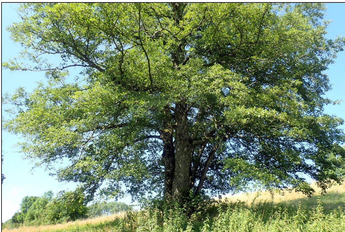
Abbildung 7: Die Grauerle im südlichen Teil der Fläche am 11. August 2021