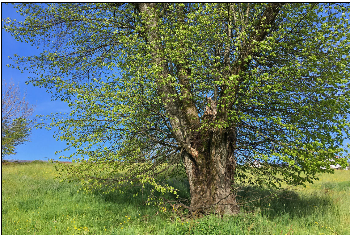
Abbildung 6: Die Linde im nördlichen Teil der Fläche am 7. Mai 2019.