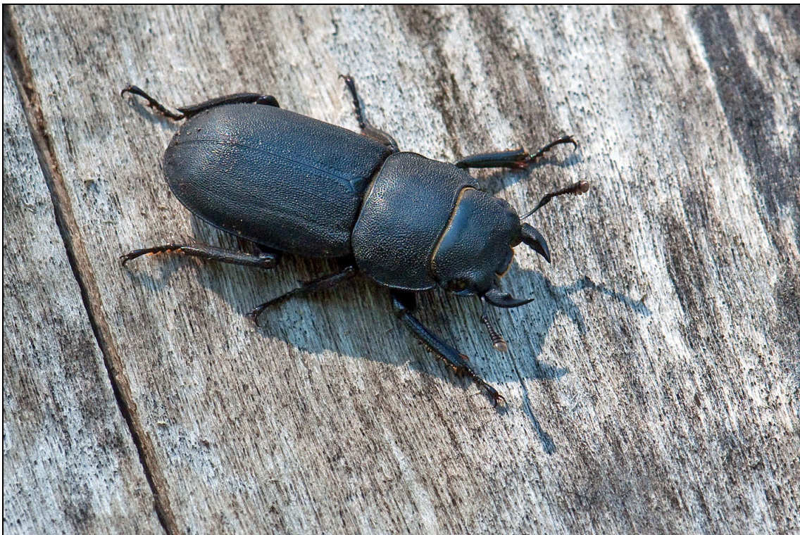
Abbildung 11: Männchen des Balkenschröters ( Dorcus parallelipipedus ); die Art brütet in der alten, anbrüchigen Linde im Gebiet. (Foto nicht aus dem Gebiet).