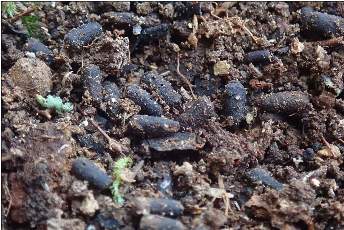
Abbildung 10: Kotpellets des geschützten Balkenschröters ( Dorcus parallelipipedus ) im Mulm der Bruchstelle an der Linde, 11.8.2021.