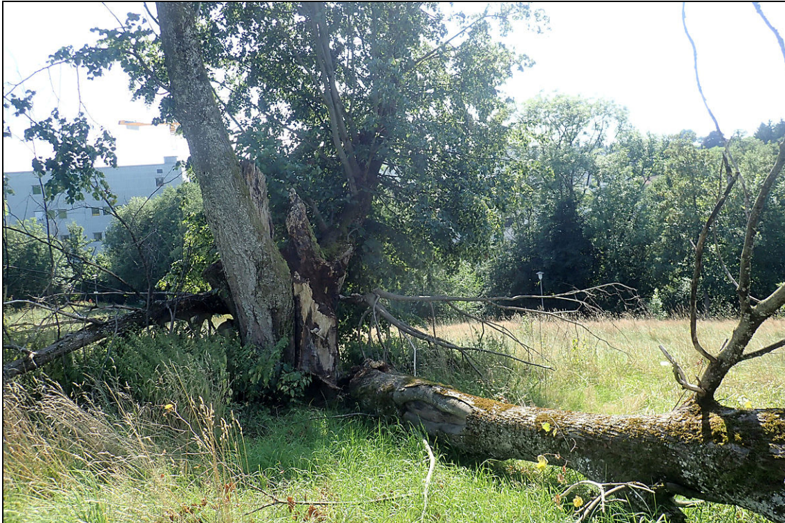
Abbildung 8: Die Linde am 11.8.2021 mit frisch umgestürztem Stämmling und abgebrochenem Starkast (links).