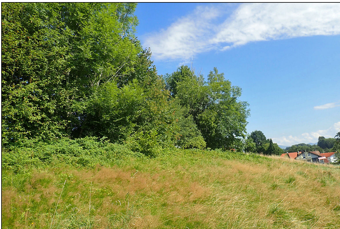
Abbildung 5: Die Hecke an der oberen Hangkante mit dem sich ausbreitenden Brombeersaum und der aufgelassenen Wiese. 11.8.2021