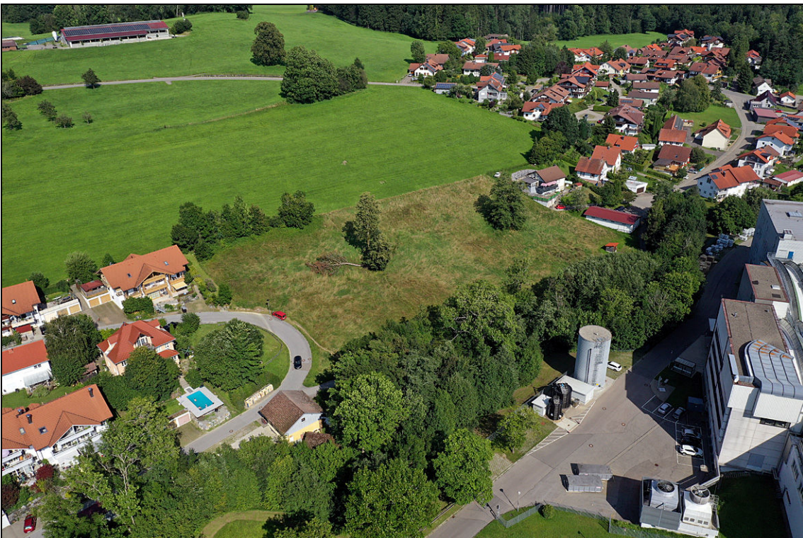
Abbildung 3: Blick von Nordwesten am 11.8.2021; erkennbar sind die brachgefallene Wiese und der abgebrochene Stämming der Linde (Bildmitte).