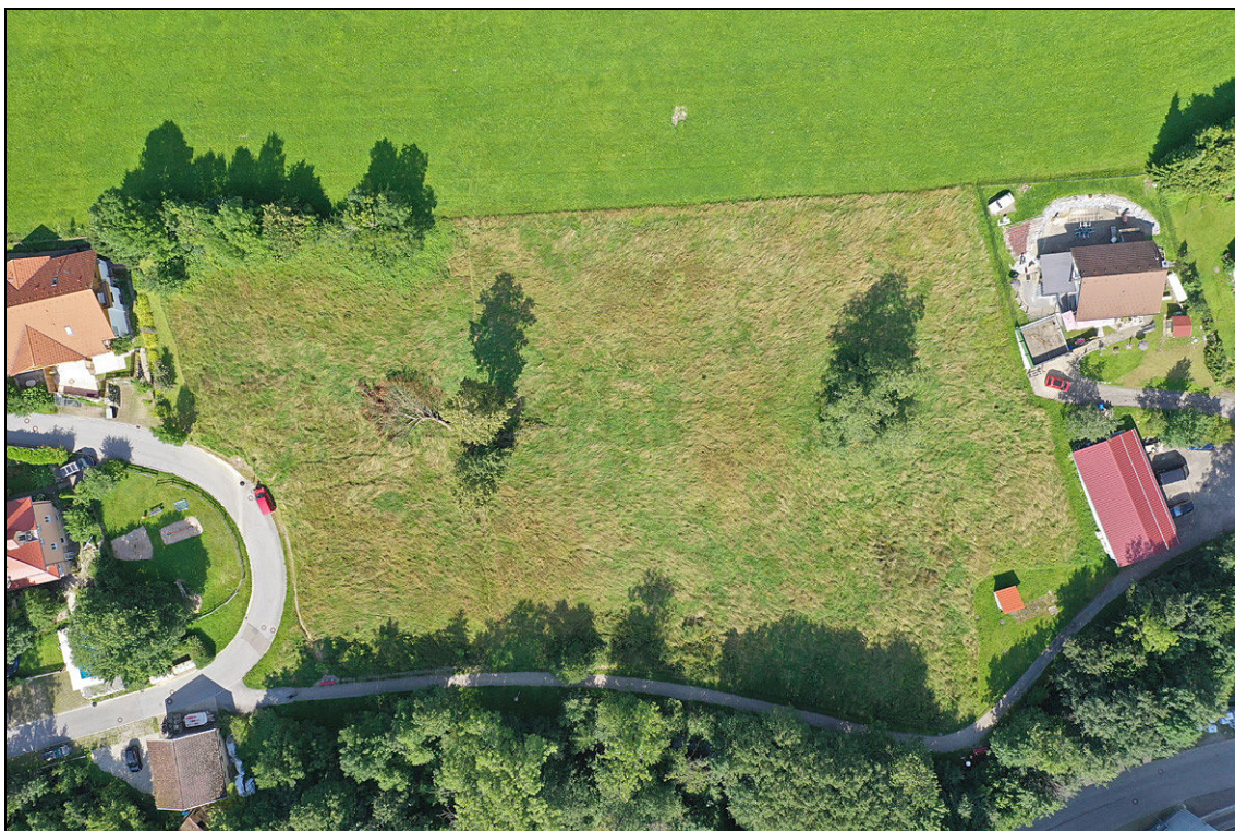
Abbildung 4: Blick von oben auf die Fläche am 11.8.2021.