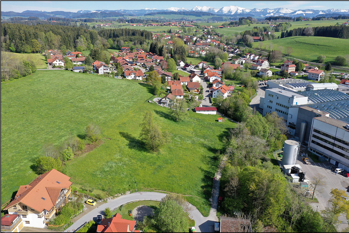
Abbildung 2: Blick über das Plangebiet etwa von Norden am 7. Mai 2019..