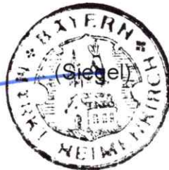
Markus Reichart Erster Bürgermeister