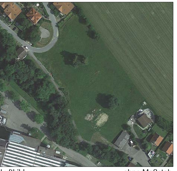
Luftbild ohne Maßstab