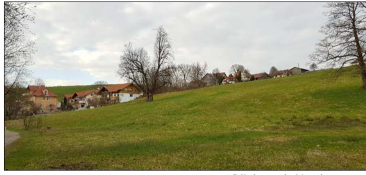
Blick nach Nordwesten

Straßen Wege Grünflächen, öffentl. 1.320 m 2 30 m 2 1.045 m 2