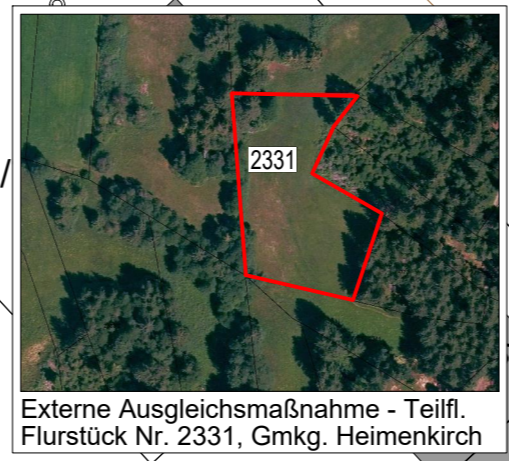
Externe Ausgleichsmaßnahme - Teilfl. Flurstück Nr. 2331, Gmkg. Heimenkirch