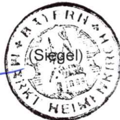
Markus Reichart Erster Bürgermeister