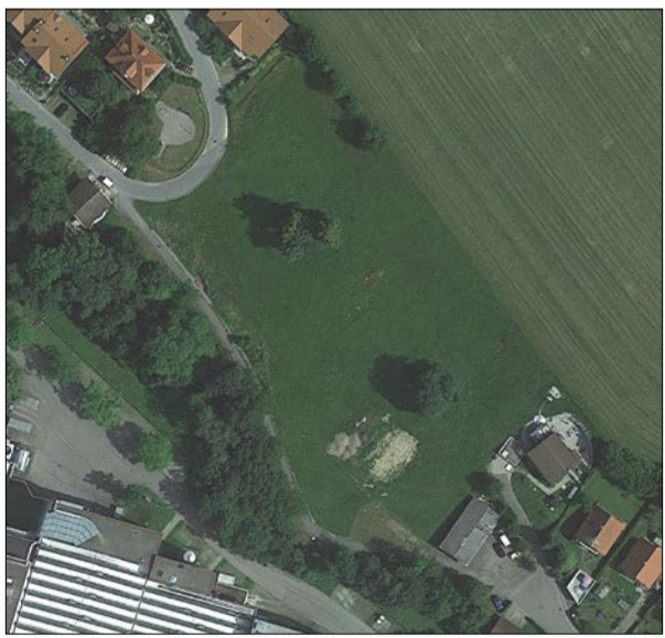
Luftbild ohne Maßstab