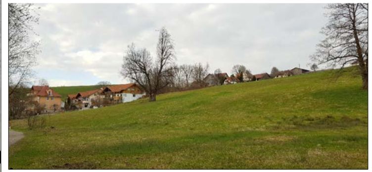
Blick nach Nordwesten

Straßen 1.030 m 2 Geh- und Radwege 320 m 2 Grünflächen, öffentl. 730 m 2