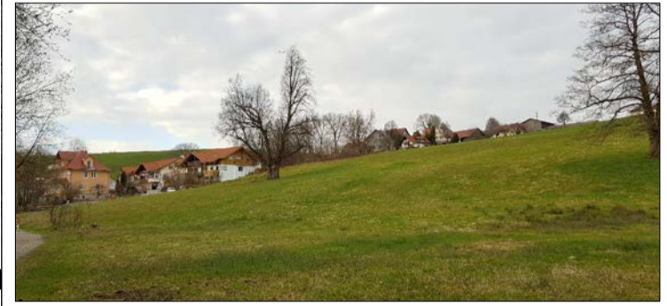
Blick nach Nordwesten

Straßen 1.265 m 2 Parkierung, öffentl. (4) 50 m 2 Grünflächen, öffentl. 1.705 m 2