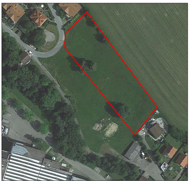
Luftbild ohne Maßstab