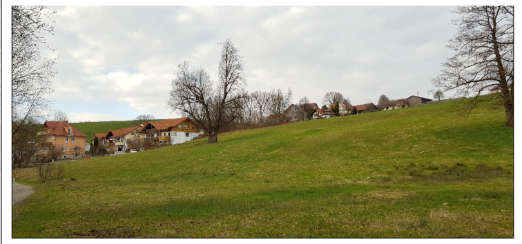
Blick nach Nordwesten